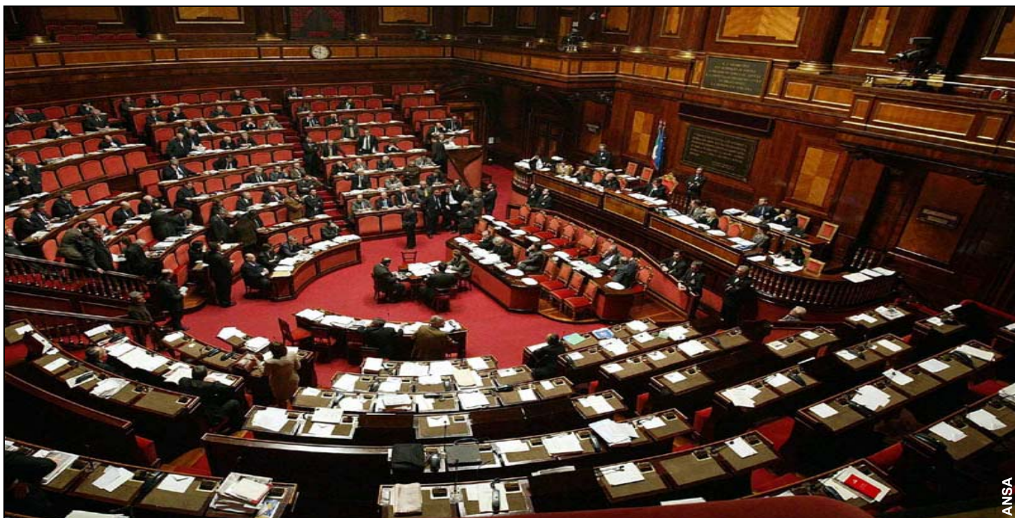
L'assemblea del Senato