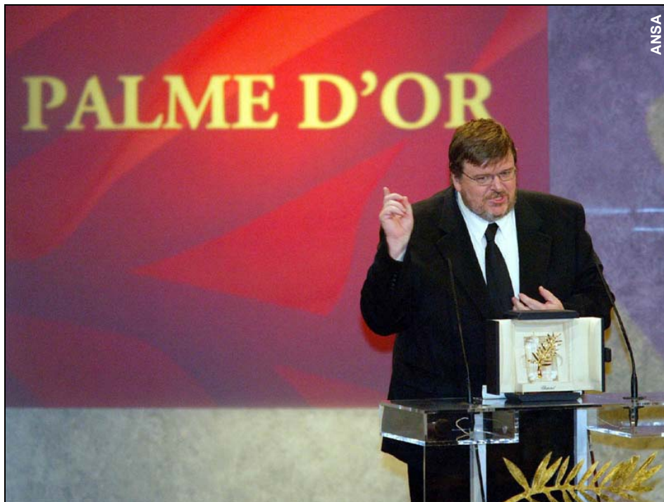
Il regista Michael Moore