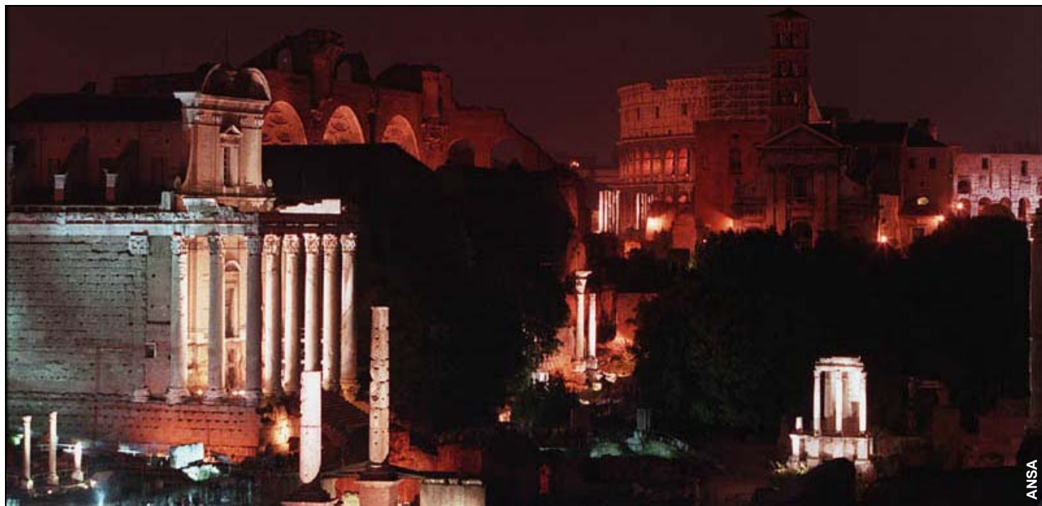
La Basilica di Massenzio a Roma