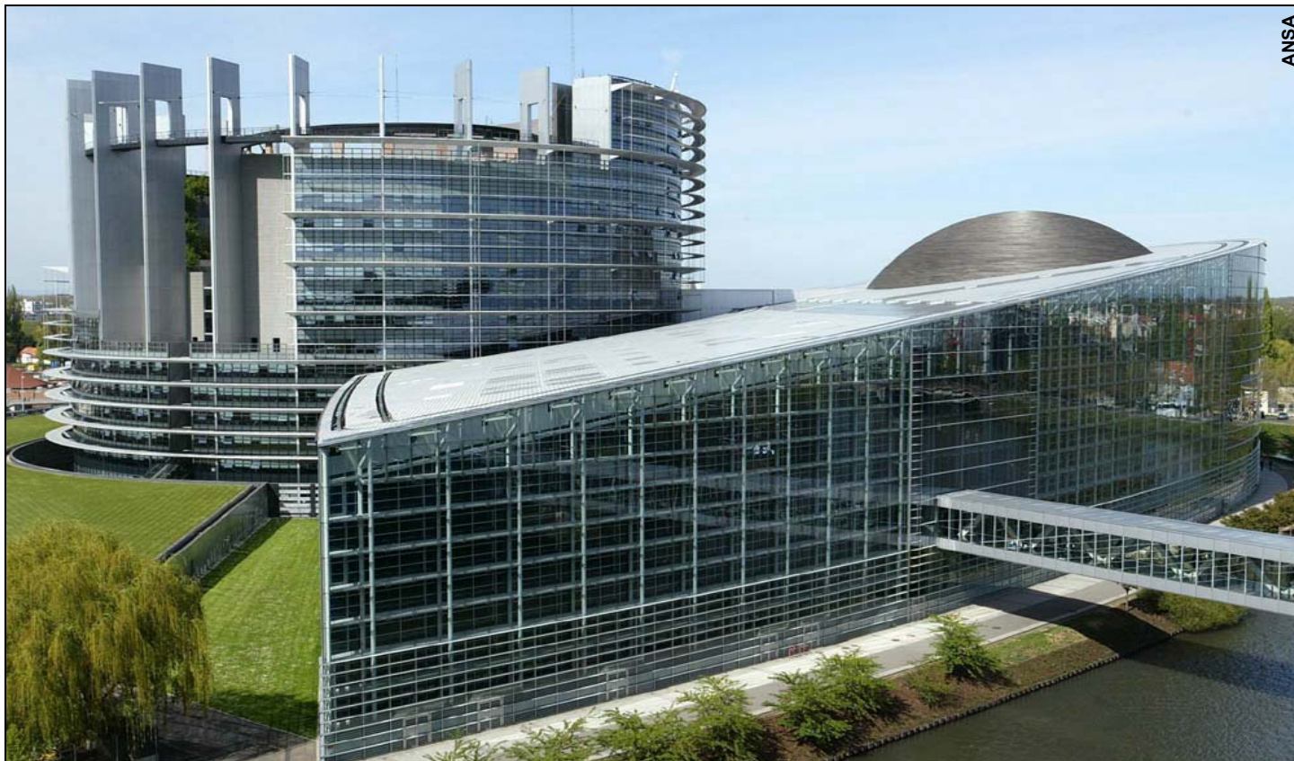
Il palazzo del Parlamento europeo a Strasburgo, in Francia